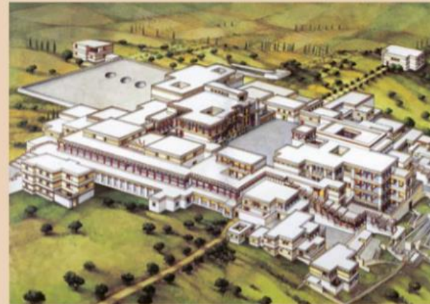
Reconstructietekening van het paleis van Knossos op Kreta.

In de tijd van dit verhaal is Aegeus koning van de Griekse stad Athene. Maar op het eiland Kreta heerst een machtiger koning, Minos genaamd. Speciaal voor hem heeft de architect Daedalus in de stad Knossos een indrukwekkend paleis ontworpen.