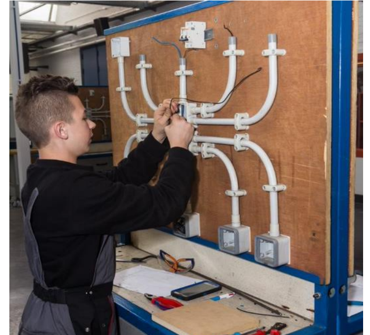
Elektrische basiskennis opbouwen