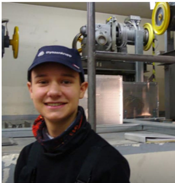
Praktijk oefenen op bedrijf