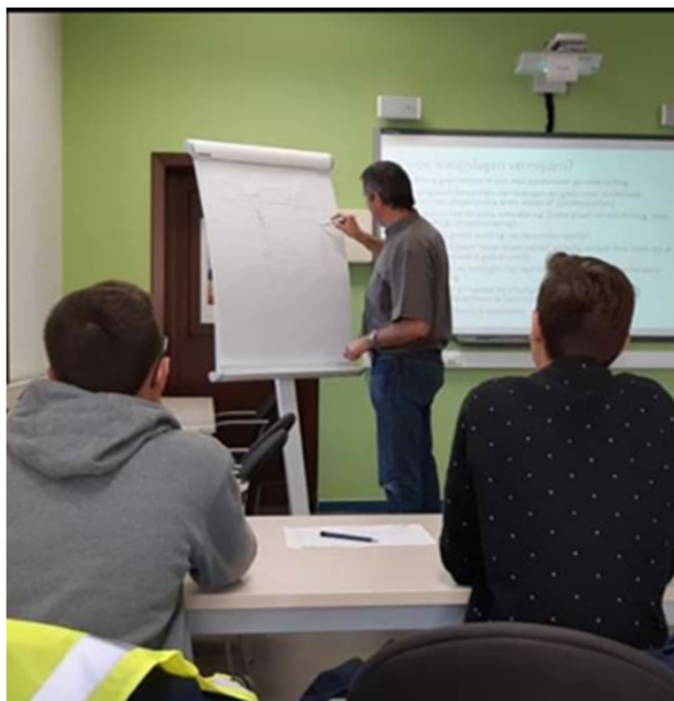
Leren op bedrijf