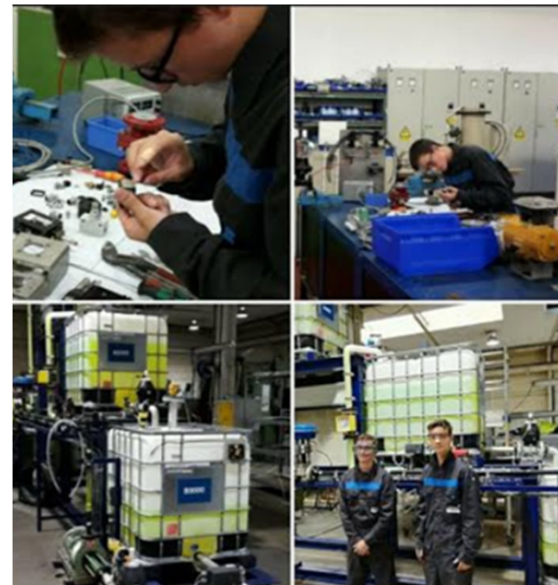
Roteren tussen bedrijven