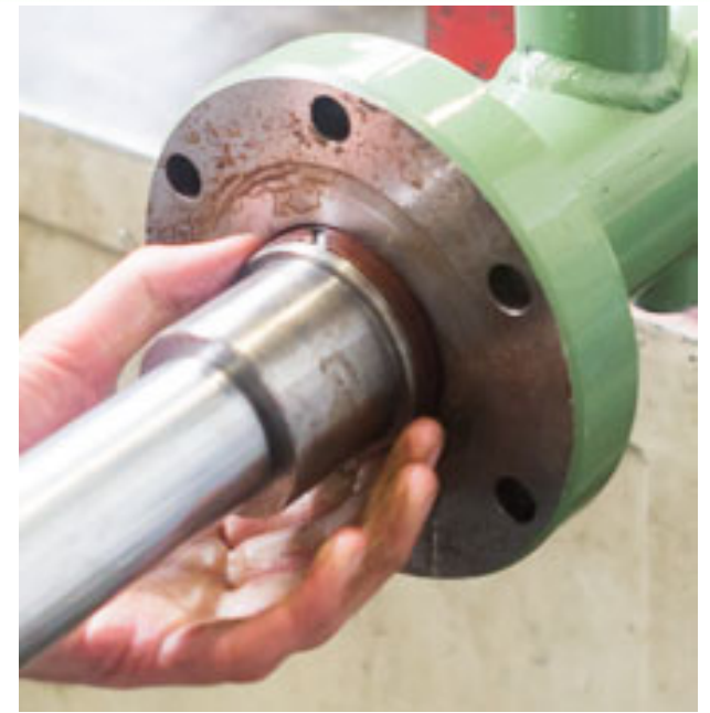
Herstellen van een hydraulische cilinder