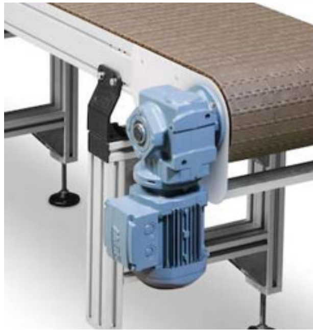
Montage van een transportband