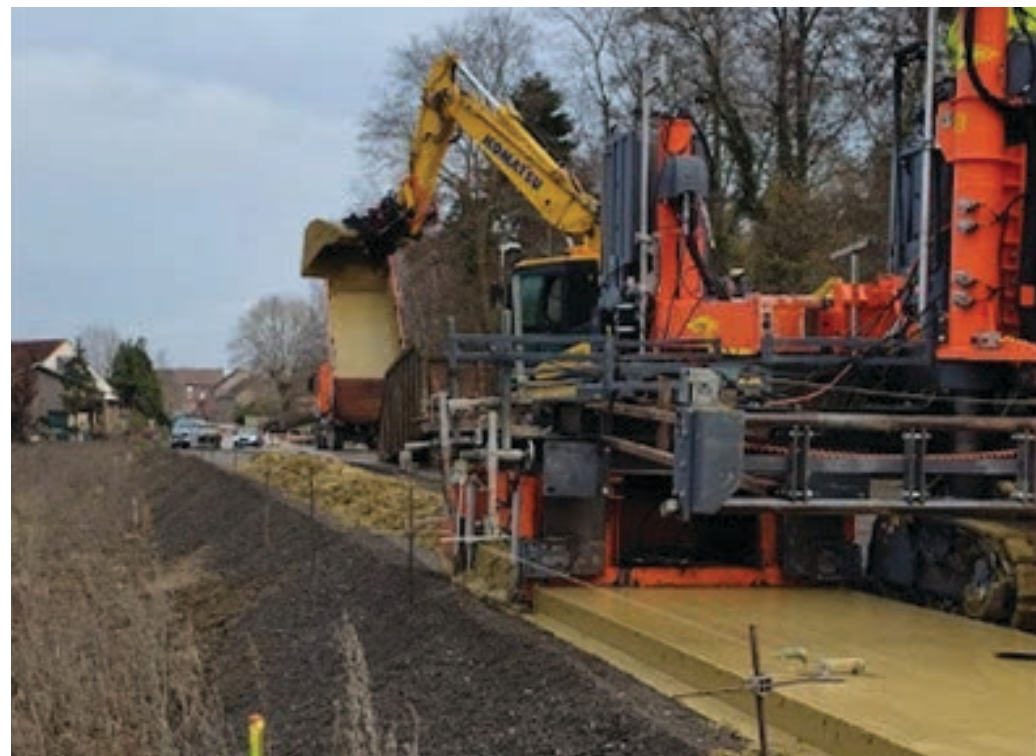
9 - Glijbekisting: aanbouw van een betonnen fietspad