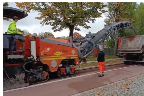
1 - Asfaltfreesmachine