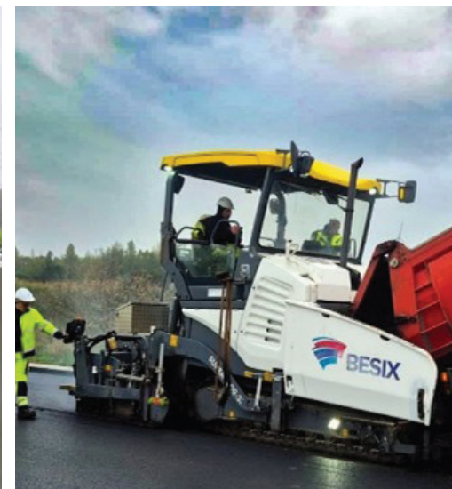
4 - Asfaltspreidmachine gevuld door vrachtwagen