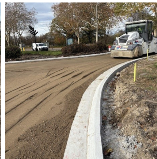
6 - bandenwals op wegfundering