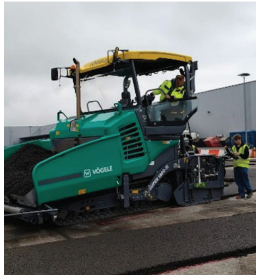
12 - Praktische opleiding tijdens de 3 daagse