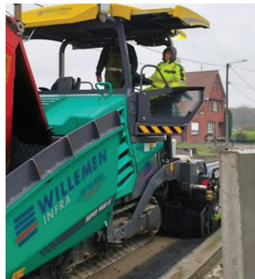
3 - Asfaltspreidmachine