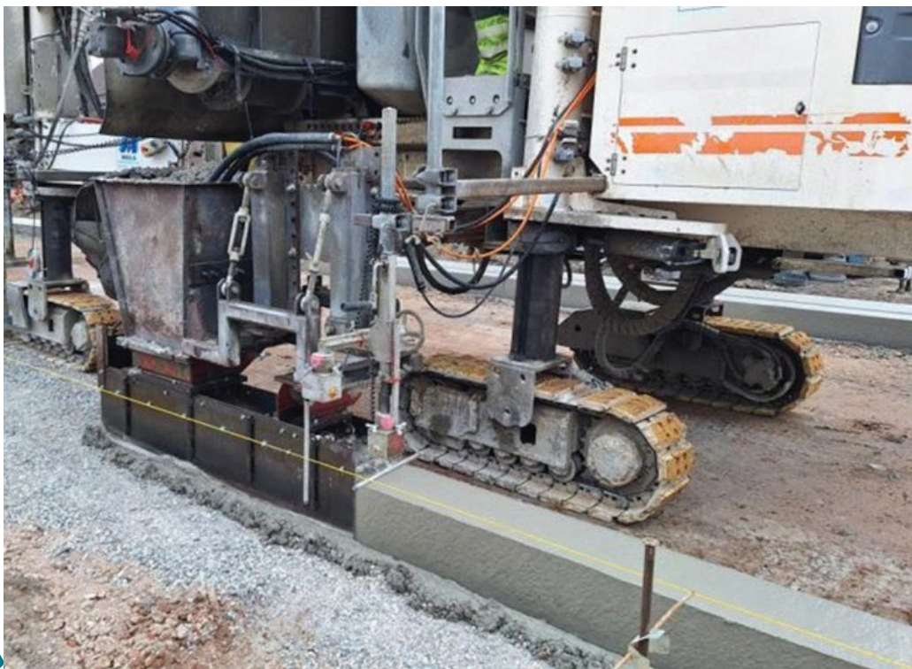
7 - Glijbekisting: kantstrook van de weg