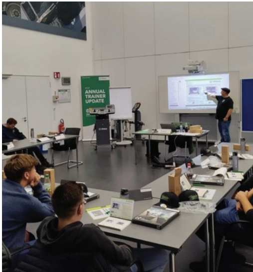
11 - Theoretische opleiding tijdens de 3 daagse