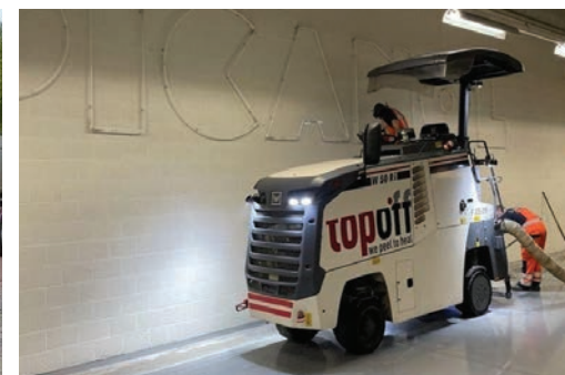
2 - Betonfreesmachine