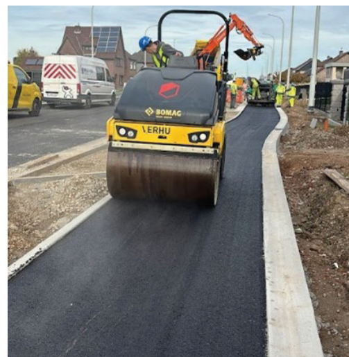
5 - Tandemwals op asfalt