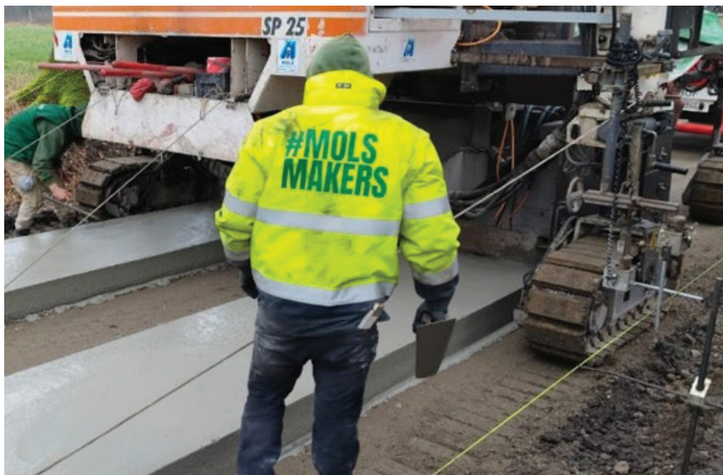
8 - Glijbekisting in alle vormen en maten